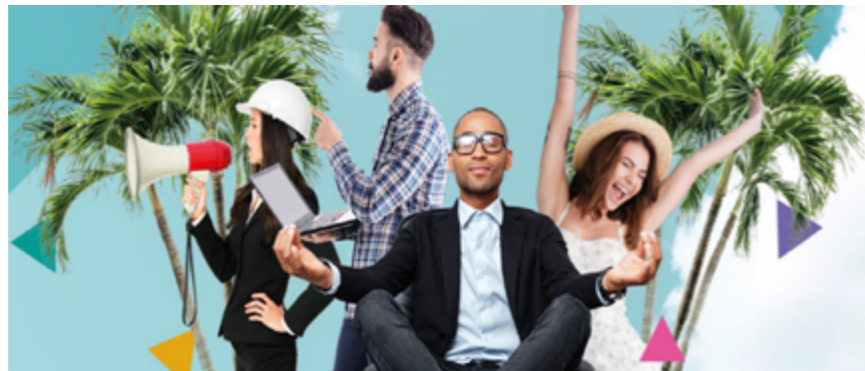
Le détail des avantages sur le site : www.cezam-grandest.fr

possible moyennant le paiement de 1€ en plus.