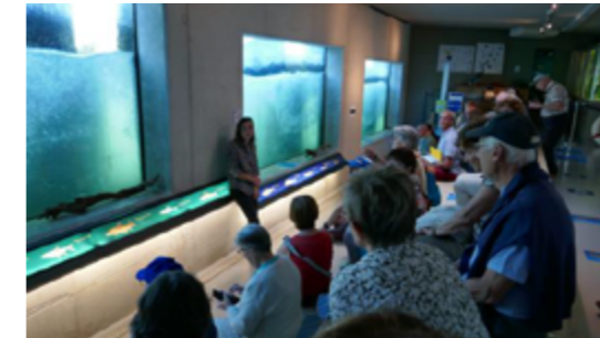
La salle pour observer les poissons.

L'écosystème du Rhin et les poissons qui le peuplent ont intéressé les participants à la sortie à Gambenheim et au polder de Fort-Louis proposée par la commission Loisirs de la Cfdt Retraités 67 en juin dernier. Les membres de la commission sauront s'adapter pour permettre des retrouvailles conviviales dès que possible.