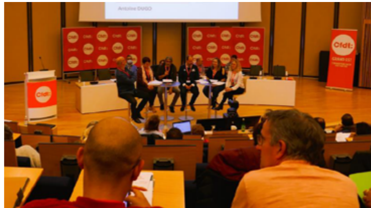
Du 8 au 10 novembre, 94 syndicats étaient représentés au congrès réuni au Bischberg.

Le syndicat Cfdt Retraités 67 fait partie des 94 syndicats Cfdt du Grand-Est réunis au Bischberg (Bischoffsheim) pour le congrès de l'Union régionale interprofessionnelle Cfdt appelée URI Grand-Est. Près de 250 congressistes étaient présents les 8, 9 et 10 novembre. Les Bas-Rhinois tenaient le stand du syndicat des retraités.