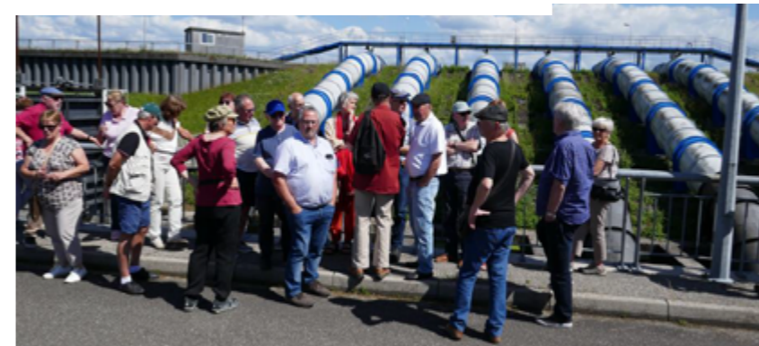
Le polder de la Moder est l'un des ouvrages permettant de réguler les ondes de crue du Rhin.

est programmée le 2 décembre. Jacky Ballinger