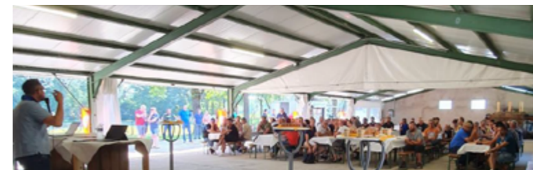
La section a tenu son assemblée à Gambenheim.

La section Cfdt des employés de Voies navigables de France (VNF) a tenu son assemblée générale à l'étang de pêche à Gambenheim. C'était l'occasion de présenter la section Cfdt Retraités (UTR) et ses services. Depuis des adhérents retraités ont rejoint l'UTR. Le syndicat VNF est notamment mobilisé pour stopper la baisse annuelle des effectifs. Il veut notamment que « les postes vacants des organigrammes en place soient pourvus et obtenir des moyens humains supplémentaires pour conduire le projet de modernisation ».